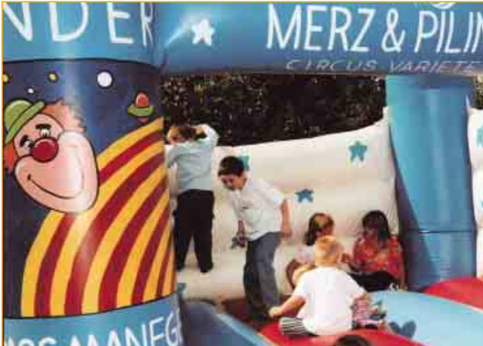
Hüpfen und springen in der Burg – Spaß ohne Ende bietet das Sommerfest der GVG

Lassen Sie sich einladen, feiern Sie mit! Es gibt keinen Vorverkauf und keine Tagesskasse. Der Eintritt zu einem großartigen Samstag für die ganze Familie ist kostenlos. Kommen Sie vorbei!