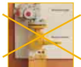
NICHT mit dem Hauptabsperrhahn die gesamte Gaszufuhr absperrn