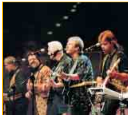
Verwandlungskünstler und Jahrmärkte, Spiel und Spaß, Live-Musik und Aktion – der 26. Juli bietet jede Menge für Groß und Klein